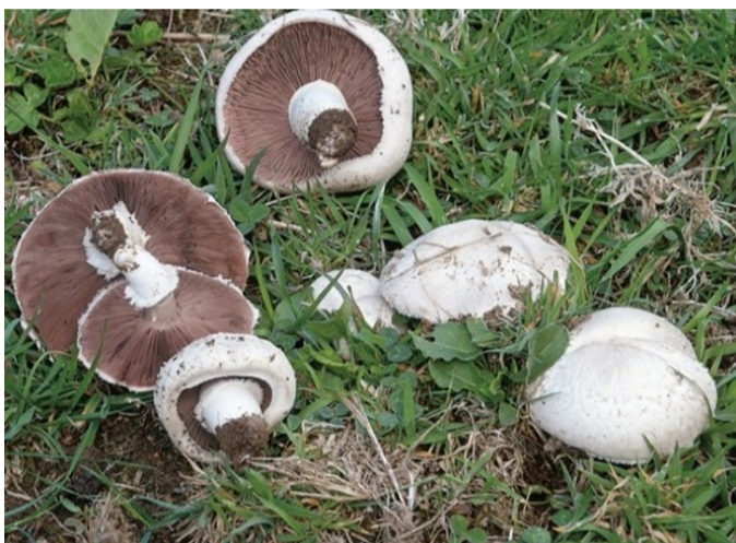
Les petits roses

En même temps que les champignons nous ramassons les châtaignes que nous grillions et pour les conserver nous les congelions.