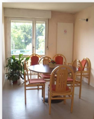
Petit salon au 1er étage

Un parking à l'arrière de l'établissement permet aux visiteurs de stationner leurs véhicules : places de stationnement et garage à vélos.