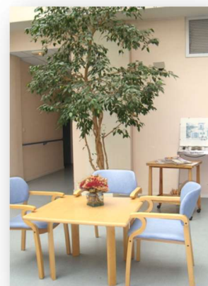
Petit salon au 2ème étage