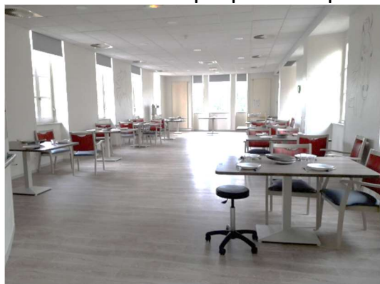
Salle à manger 2ème étage

Une collation est proposée l'après-midi en salle d'animation.