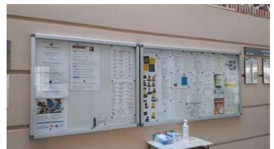
Vitrine à l'accueil

Sa compétence consultative s'exerce sur tous les domaines relatifs au fonctionnement de l'établissement (repas, animation, sorties...) et les projets.