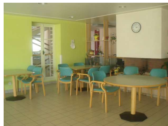
Salle à manger 1er étage