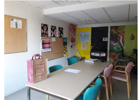
Petite salle d'animation

Elles assurent la distribution de votre courrier et proposent des activités variées du lundi au samedi : gymnastique douce, jeux de société, activités manuelles, art thérapie, cinéma, prévention des chutes avec l'association SIEL Bleu, divers ateliers (pâtisserie, mémoire, mots mêlés, mandalas...), des soins de bien-être.